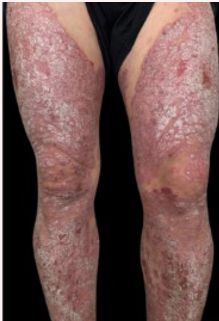
Figura 3. Compromiso en miembros inferiores, cara anterior con compromiso articular (rodillas y tobillos).