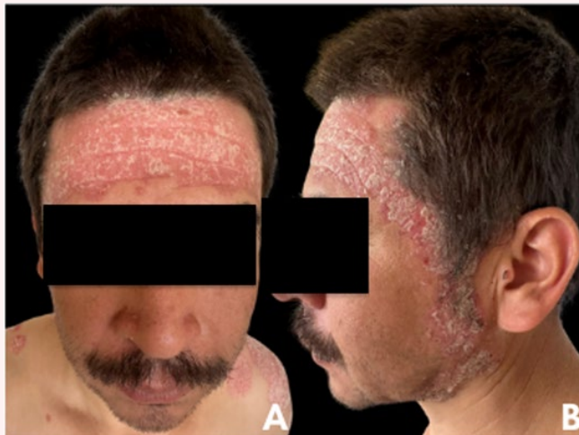
Figura 2. (A, B) Compromiso facial y de piel cabelluda, con extensión retroauricular.